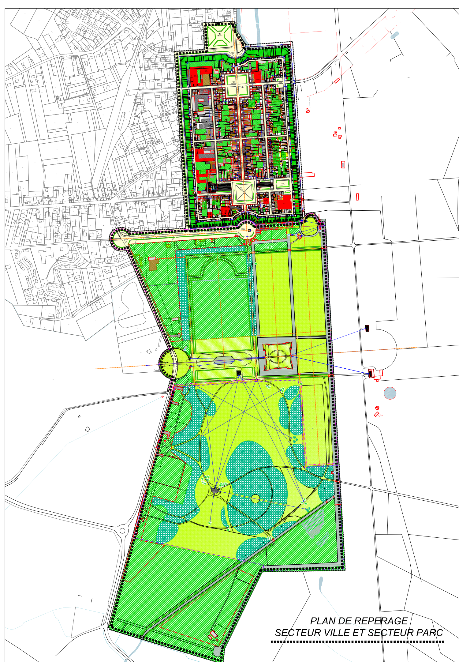
PLAN DE REPERAGE SECTEUR VILLE ET SECTEUR PARC